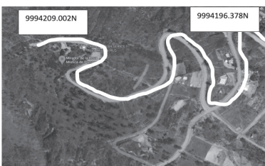
Gráfico N° 1 Ubicación del tramo total calle Simón Bolívar – Rosa Mística